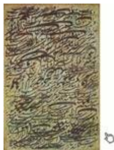
Exemple de siâh mashq

L'écriture islamique tout en assurant la transmission d'un texte semble "goûter un plaisir infini aux excès et retards de rythmes qui naissent de la tension du poignet, de même qu'aux suggestions de l'encre et aux séductions d'une ligne spontanément portée à l'arabesque.[...] La page du calligraphe oriental fait penser à une végétation laissée à elle-même , abondante et parfois un peu folle, envahissant la surface selon qu'elle trouve ou non à fleurir : tapis, tissu mobile, fragile, qui tient caché sous son dessin savant le secret de l'univers, voile délicat jeté sur un corps vide." (Florian Rodari). Dans la calligraphie islamique , la calligraphie persane constitue un ensemble original caractérisé par le raffinement particulier de ce qui fut souvent un art de cour : mêlant esprit de jeu et profondeur mystique, elle repose sur l'ambiguïté poétique d'une écriture qui n'a pas été créée pour la langue qu'elle s'est vue contrainte de noter.